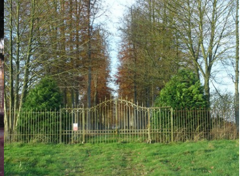
L'avenue des Tilleuls

Pour la zone en rose foncé dans le périmètre de 500m