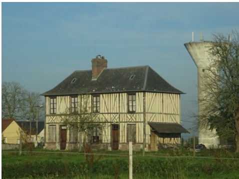
Quelques maisons voisines à pans de bois