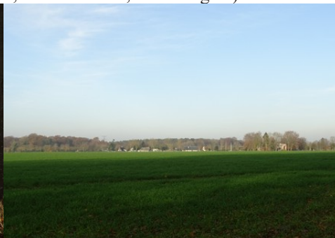
La vue vers le Nord