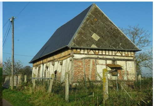
Le bâti rural avoisinant