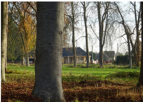
Les maisons alentours en milieu boisé

Les avis seront cohérents avec ceux émis ces dernières années, à savoir : pas de maisons à volume compliqué (type V, W, Y, ou Z), pentes à 45° pour les volumes principaux, ardoise ou tuile plate de teinte brun vieilli, à 20u/m 2 , avec un débord de toiture de 20cm, enduit de teinte beige clair avec modénatures (au choix : chaînages, encadrement de fenêtres, soubassement, colombage...). *Voir les autres fiches.