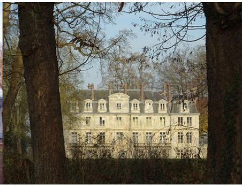
La façade sud du château depuis le parc