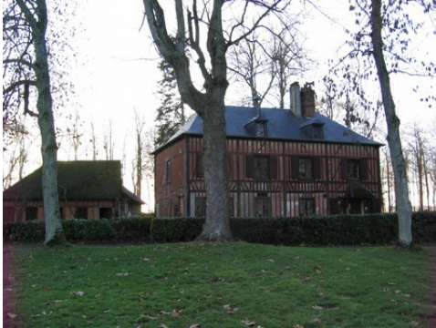
Les dépendances dans le parc