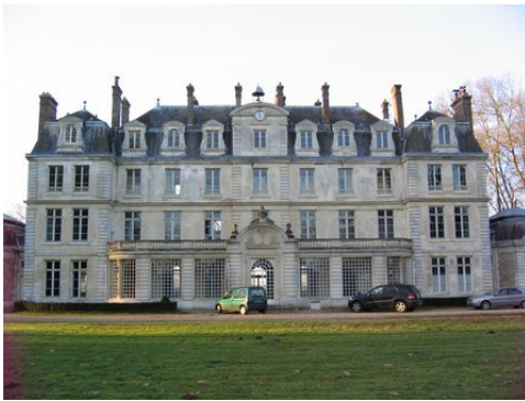
La façade sud du château (vue proche)