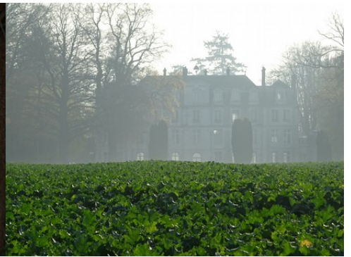
Le château depuis les champs au Nord